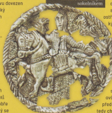
Stříbrný velkomoravský terčík s takzvaným sokolníkem

„Můj věrný Pribina, kterému jsem dal veškerou důvěru a moc, aby k větší slávě Moravanů spravoval Nitru a s ní i široké kraje, které jsme s pomocí boží